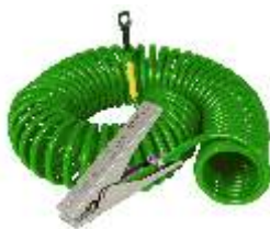
Pince en acier inoxydable VESX45 avec câble Cen-Stat de 3 m, 5 m ou 10 m de long. Dimensions de la pince: 120 mm (4,7 po)