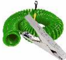
Pince en acier inoxydable VESX90 avec câble Cen-Stat de 3 m, 5 m ou 10 m de long. Dimensions de la pince: 235 mm (9 po)