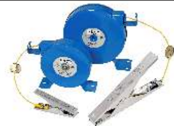
Pince en acier inoxydable VESX45 ou VESX90 avec câble de haute visibilité de 6,1 m, 9,2 m ou 15,2 m de long.