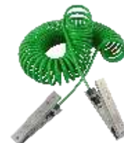
Une pince en acier inoxydable VESX45 raccordée à un câble Cen-Stat de 3 m de long. Dimensions de la pince: 120 mm (4,7 po)

La gamme X45 et X90 fait partie de la gamme Cen-Stat de matériel de liaison et de mise à la terre de l'électricité statique disponible chez Newson Gale.